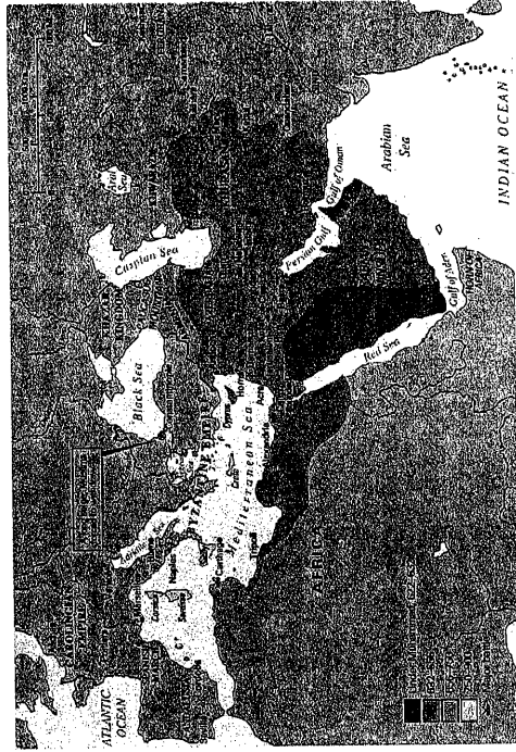
MAPA I 99 La Expansión del Islam